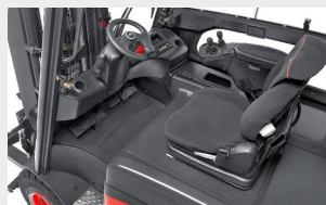
Førersete med ekstra komfort og innstillingsmuligheter