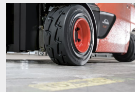
Antispinn og rå framkommelighet