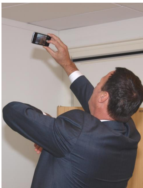
Før start måtte den moderne idrettsleder ta en "Selfi".

Den andre linjen er 54 Særforbund som er fellesorgan for en spesifikk idrett nasjonalt, særkrets som er fylkes-/regionsledd for den spesifikke idretten. Begge linjer ender opp i Idrettslaget som kan ha grupper av ulike idretter.