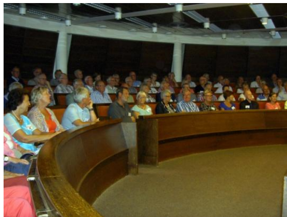
Orientering i Ålands regjeringsal

Åland har altså et selvstyrt landskap som hører til Finland. Åland har rett til å innstifte sine egne lover innen en rekke områder som utdanning, trafikk, helsevesen og næringsliv. Også økonomien er selvstendig. De har eget flagg som de fikk i 1954 og eget postverk som gir ut egne frimerker. Selvstyredagen feires 9. juni. Språket er svensk. Sjøfarten er den viktigste næringen og gjennom den har Åland hatt tette kontakter til omverdenen i århundrer. I dag velger også mange å flytte til Åland fra andre land både i og utenfor Europa. Åland ansees som et ganske unikt land fordi selvstyret har bestått over så lang tid, at løsningen er framkommet uten væpnet konflikt og at Åland både er selvstyrt og demilitarisert.