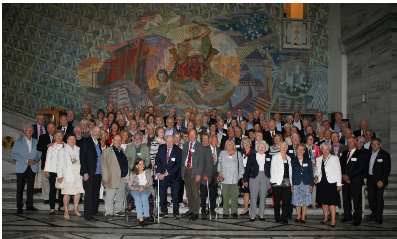
Deltakerne samlet i Oslo rådhus

Nordisk konferanse vel i havn – og takk for det!