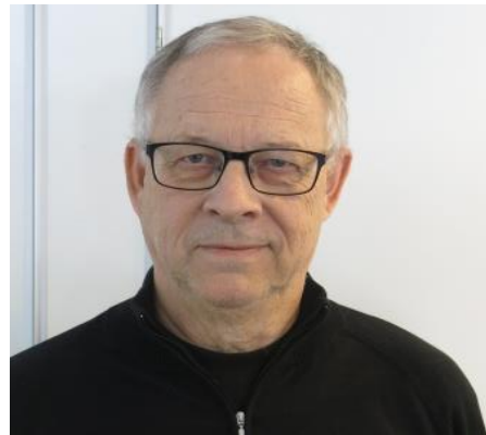
Lars Lagerbäck trener for herrelandslaget i fotball