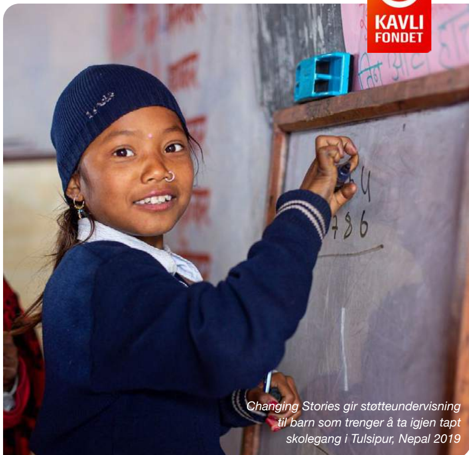
Changing Stories gir støtteundervisning til barn som trenger å ta igjen tapt skolegang i Tulsipur, Nepal 2019

Kavlifondets finansportefølje har, utenom lån til Kavli Holding AS, en