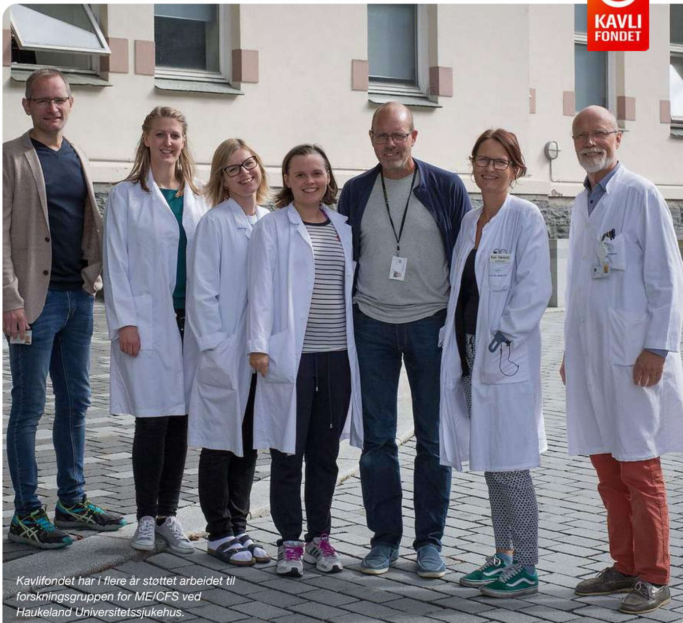
Kavlifondet har i flere år støttet arbeidet til forskningsgruppen for ME/CFS ved Haukeland Universitetssjukehus.