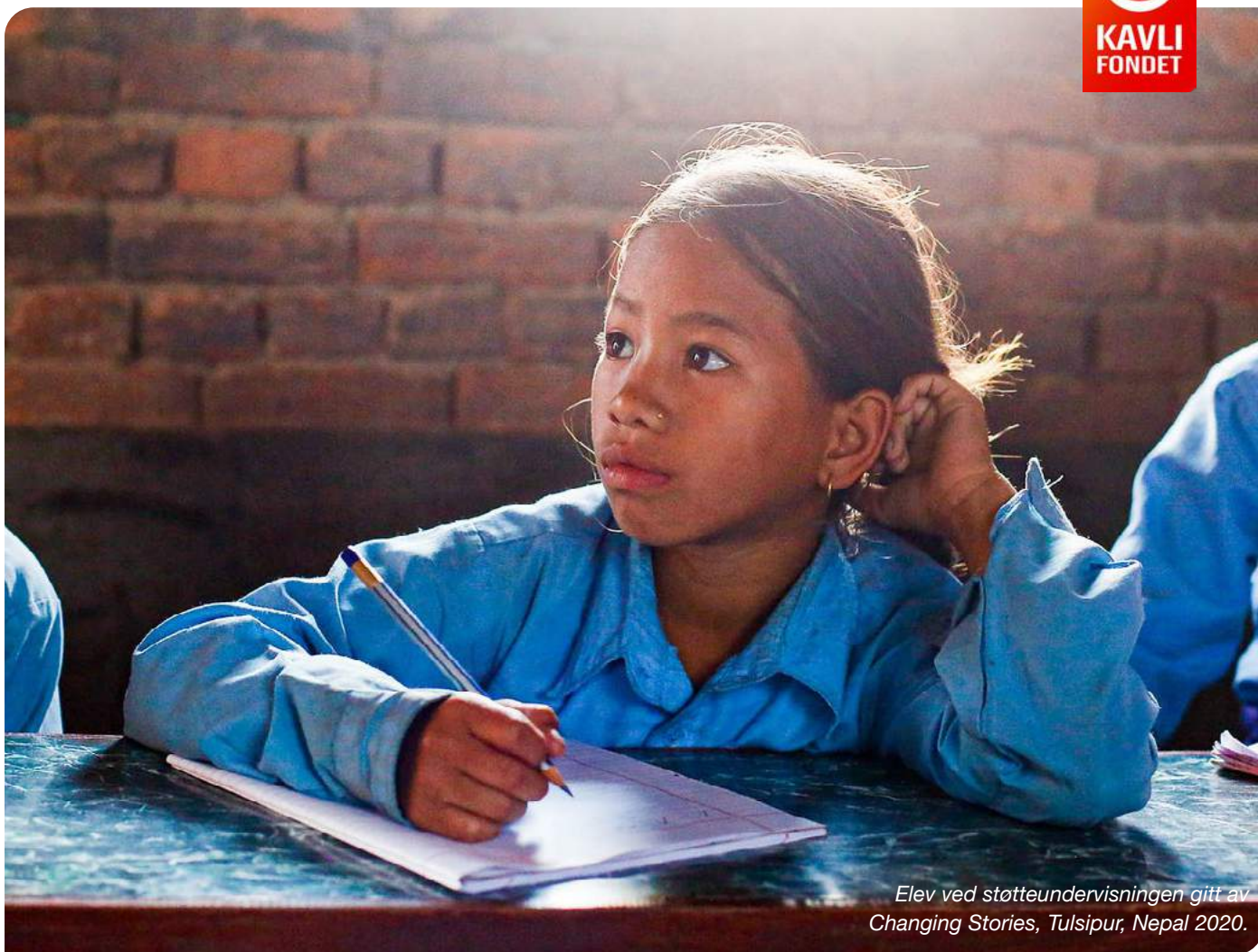
Elev ved støtteundervisningen gitt av Changing Stories, Tulsipur, Nepal 2020.