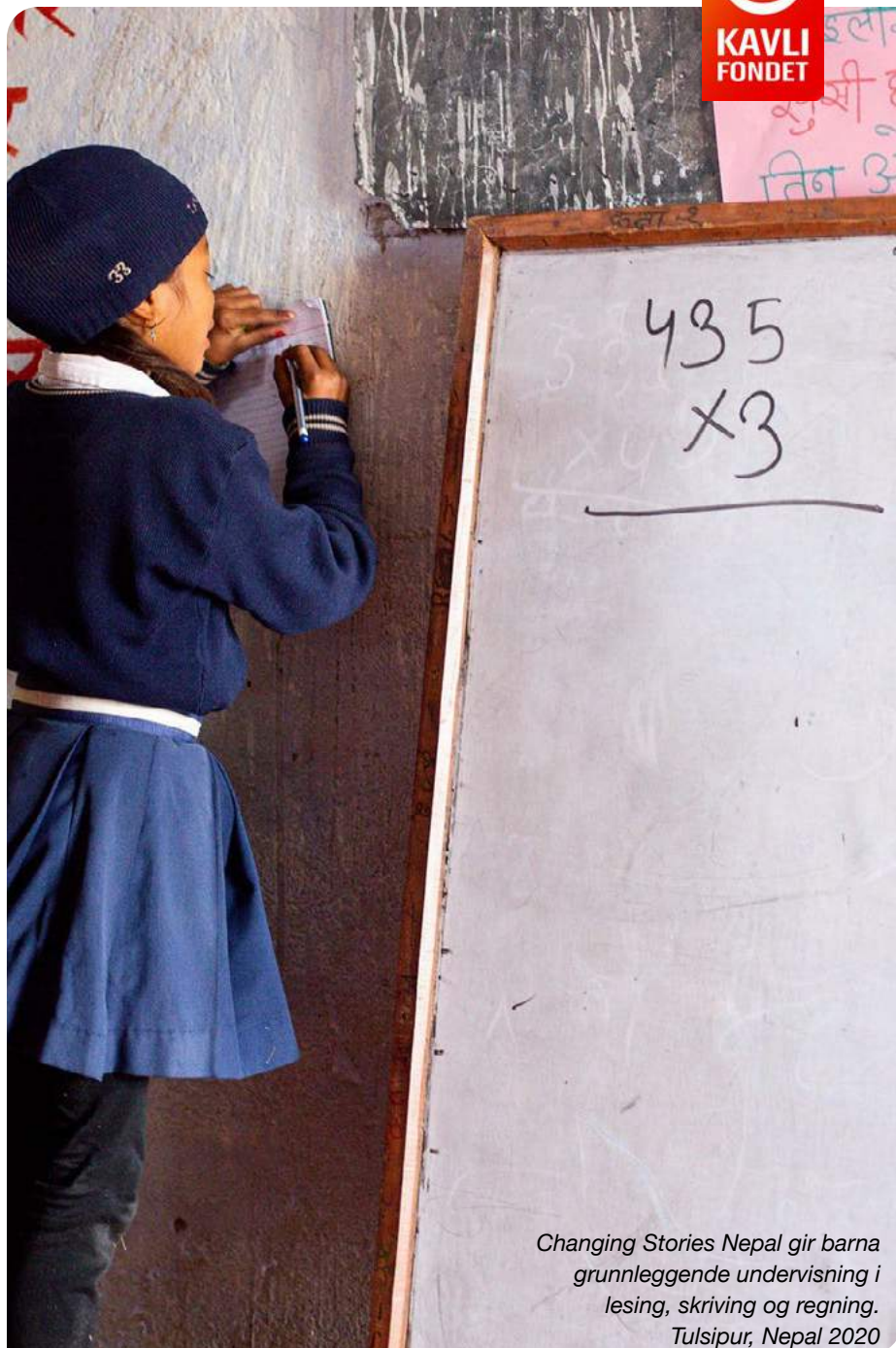
Changing Stories Nepal gir barna grunnleggende undervisning i lesing, skriving og regning. Tulsipur, Nepal 2020

Kavlifondet har flere samarbeidspartnere som bidrar til å hjelpe andre mennesker både til vanlig og i denne helt spesielle krisesituasjonen. Flere av disse stiller i dag opp og bidrar til å hjelpe dem som rammes aller hardest, som mennesker i utenforskap og