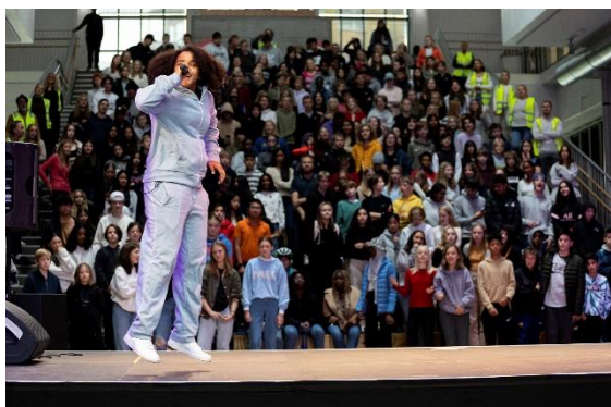
Fra Kulturfest Frydenberg på Frydenberg skole i Oslo. Arrangert av DKS Oslo og Miniøya i september 2021