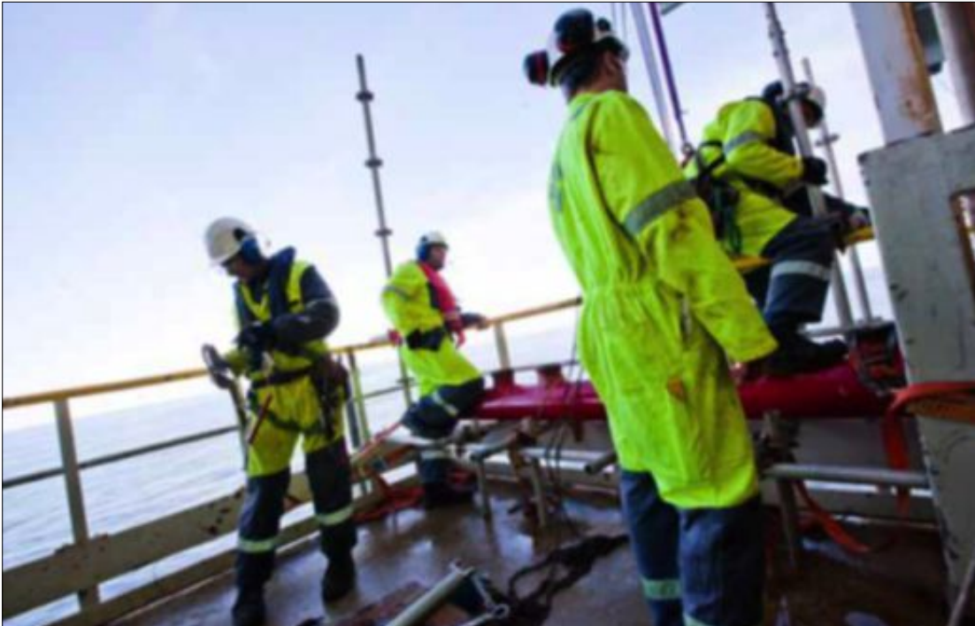
SNART SLUTT? Siden fagforeningene unnlot å utvide streiken, vil arbeidsgiverne snakke med dem igjen.