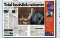
Klassekampen 25. april

den rolla storkapital og «dei gamle maktene» spelte og har spelt med omsyn til undertrykkande regimar. Augusto Pinochet var ikkje demoseinare gjorde det i Storbritannia.