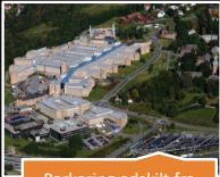
Parkering adskilt fra bolig eller arbeid