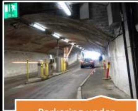
Parkering under terreng