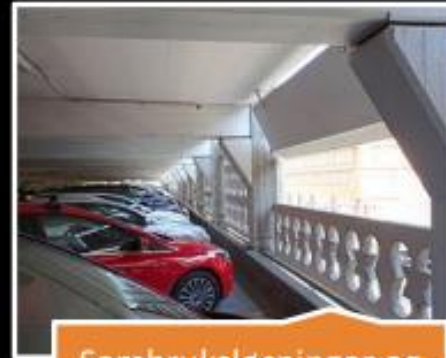
Sambruksløsninger og frikjøp