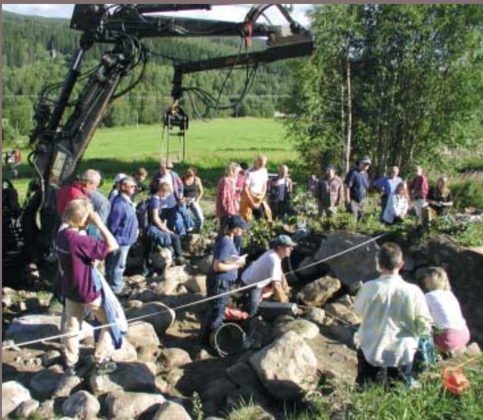
Skog och historiagrupp på studiebesök i Böle vid Sidsjön där arkeologer från Länsmuseet sommaren 2003 undersökte en gravhög från äldre järnålder.