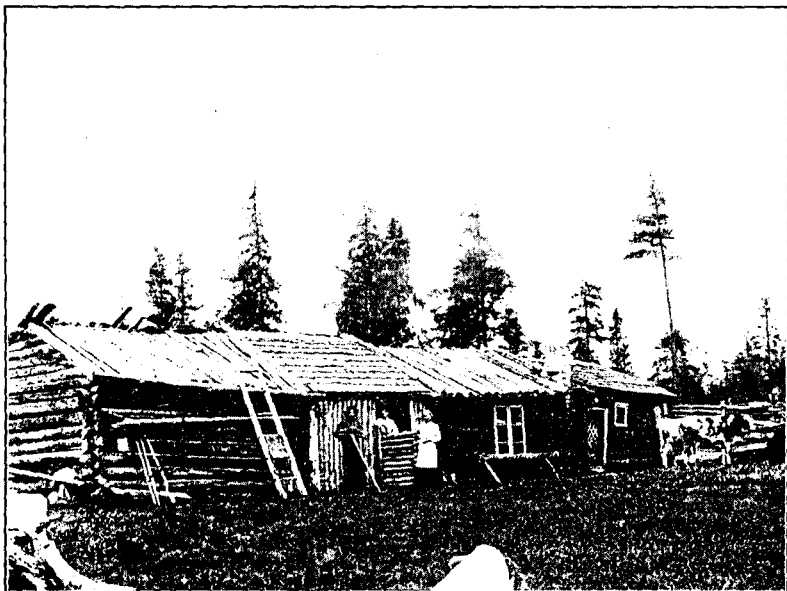
Åbyggnader på Tarasjönäs kronopark, vari familjen bodde under stridens dagar.

Historien om den envise nybyggaren där, som i sitt uppträdande icke så litet erinrar om de fornlida »landnamamännen», vilka togo sig hem och eget, var de tyckte det bäst vara, är nog inte bortglömd än. Den utspelades ären omkring världskrigets början. Där han stod utan tak över huvudet för sig och de sina, tyckade han inte att »laga land» och vad därtill behövdes, bäst han gifte; »nöd har ingen lag», menade